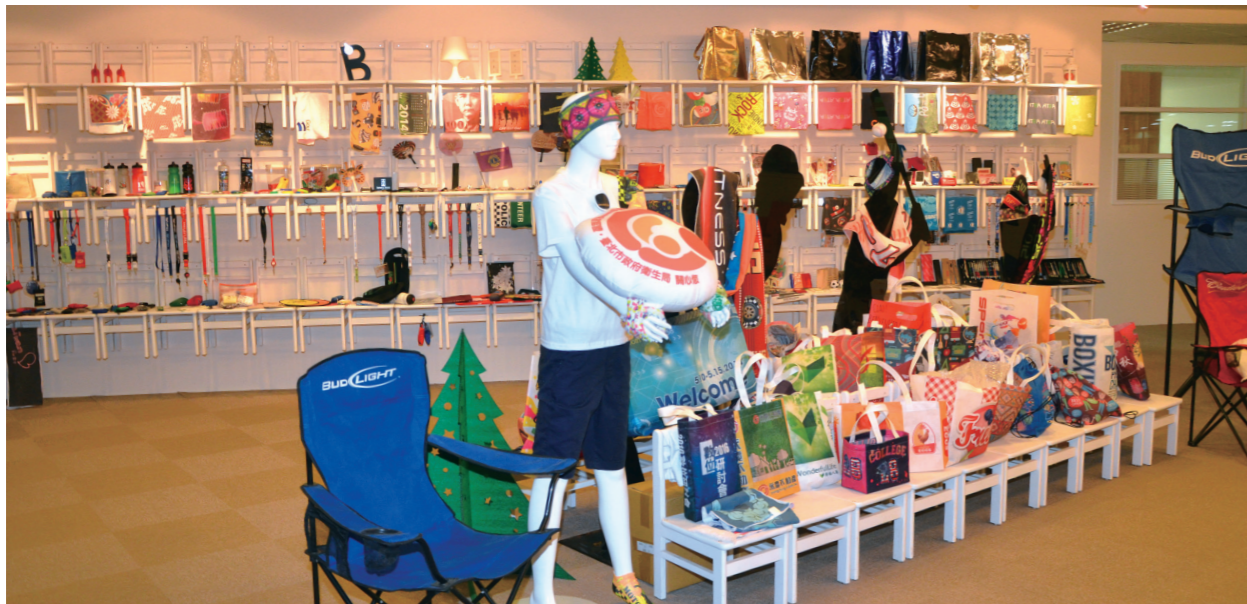
●禮想家位於內湖成功路的展示場各式禮、贈品應有盡有，而且都價廉物美

體兩面的企業無形資產，禮想家秉持著「深耕台灣」及「理想、創新」的理念，致力於先進技術和尖端設備的引進，全線人才的培訓，新型產品的不斷研究開發，多年來已卓然有成，並且獲得廣大客戶們的肯定，以及業務上的熱烈支持。禮想家的產品線可謂無所不有，從室內到室外，穿的、戴的、用的、看的，範圍極為廣泛，