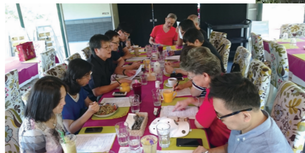
●策辦單位三位代表和聯合主辦協會12位理事長、輔導理事長於三峽皇后鎮森林共商大會籌辦事宜