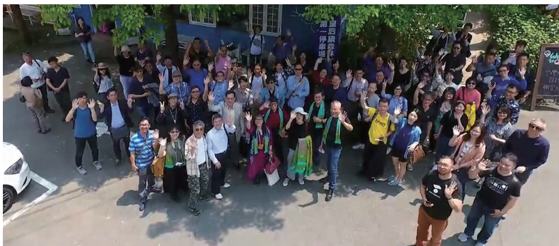
● 本次活動出席者面向空拍錄影歡樂揮手致意

(1)MEGA雲端硬碟網址： https://mega.co.nz/ (2)點擊右上角「登入」 (3)輸入電子郵件「ga2001.design@gmail.com」 (4)輸入密碼「82628822」 (5)點擊「登入」就可以開始使用雲端硬碟 (6)檔名：台灣視覺設計社團聯合大會