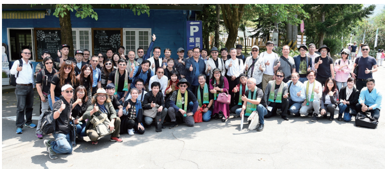
● 搭乘台南及高雄遊覽車之出席者報到合影