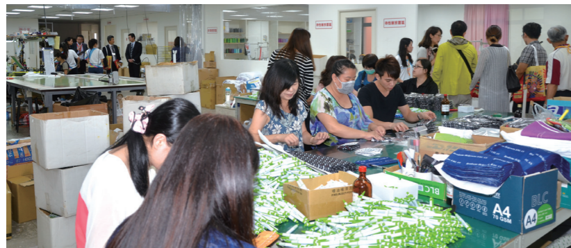
●禮想家除數位化設備之外，更有堅強的後加工服務

此外，禮想家所投資的設備當中最重要的主力機種幾乎都是Mimaki所生產或代理的，陳總曾打趣地表示，禮想家不但是Mimaki的標準示範廠，同時也是忠誠度最高的客戶，現今廠內Mimaki各種功能用途、各式規格的設備多達近20部，茲列舉如下：(1)Monti mod 70織帶熱轉印機1部。(2)Monti mod 853熱轉印機