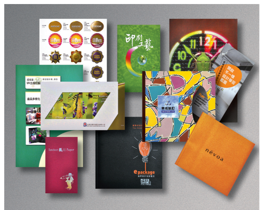
● 大會贈送每位出席者之各種相關應用型錄