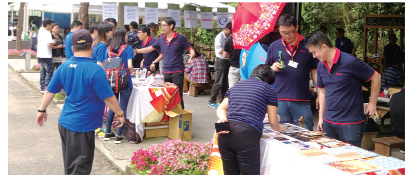
●台灣御牧公司於4月8日配合本活動在現場展示其設備及可生產之各類產品