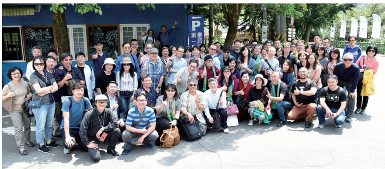
● 搭乘台中及台北第二部遊覽車之出席者報到合影