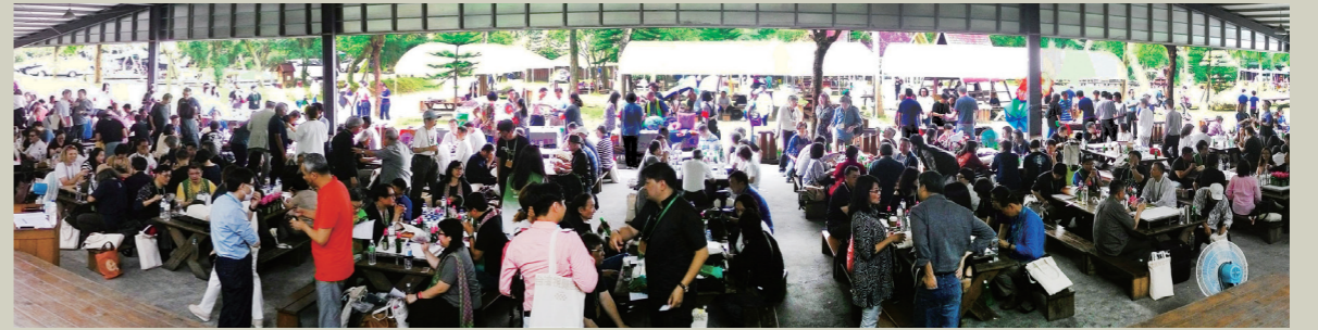
●台灣視覺設計社團聯合大會共有458人於2017年4月8日在三峽皇后鎮森林互動交流

由經濟部商業司指導、台灣北中南十大視覺設計社團共同主辦、大計文化公司及設計印象雜誌負責策劃執行的首次「台灣視覺設計社團聯合大會」，於今年的4月8日(星期六)假新北市三峽皇后鎮森林遊樂區盛大舉行；與會人士包括主辦單位10個視覺設計社團理事長、理監事及會員代表們、12個設計、印刷相關友會社團理事長、全台42位院校系所的院長、所長、系主任、39家協辦、協力、贊助廠商代表暨台灣設計界資深設計家、中國大陸地區參訪交流者等共458人共襄盛會，現場幾乎座無虛席，場面熱鬧而溫馨。