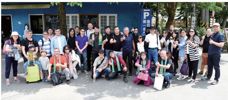
● 搭乘台北第一部遊覽車之出席者報到合影