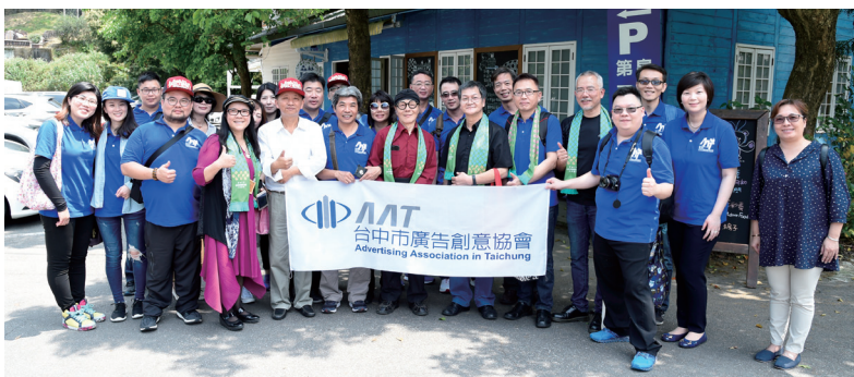
● 搭乘台中第一部遊覽車之出席者報到合影