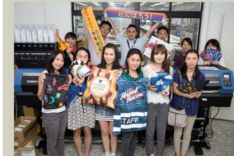
●禮想家運用TS300P-1800 1.8M寬捲封捲昇華轉印噴墨印刷機研發出許多螢光新產品