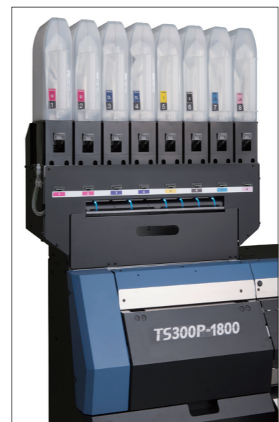
● TS300P-1800昇華轉印噴墨機配備MBIS3大容量墨水，支援長時間連續運轉

情況。(2)延長固定素材的尺寸，進而固定住印刷後素材不平整的部分，減緩素材變形。(3)具備AMF(Auto Media Feeder)收捲張力調節桿，可自動調整為最適合素材的張力，精準穩定地收捲素材。