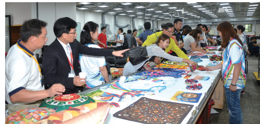
● 活動現場展示禮想家運用御牧設備印製的各類商品，引起廣大迴響

在聽完上述詳細的數位印刷優勢、技術與設備介紹後，現場來賓則開始參觀禮想家廠內的實機操作數位噴墨印刷機、熱轉(熱壓)機、雷射切割等數位機種，和現場展示最新流行時尚的螢光系列商品，共同體驗御牧數位噴墨整體工作流程的魅力，並留下深刻印象與好評。台灣御牧股份有限公司於台北、台中、高雄皆有服務據點，提供最新的技術與服務，為相關產業提供跨產品領域的解決方案、使產品提升並開闢新市場。更多TS300P-1800昇華轉印噴墨印刷機詳細資訊請向台灣御牧洽詢。 ✦ 台灣御牧 04-25330101 http://www.mimakitaiwan.com