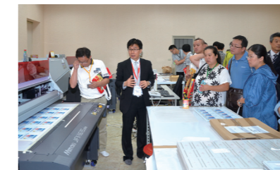
●禮想家以JFX-1615 LED-UV平台數位噴墨機印製個性化全彩手機殼、各類壓克力鑰匙圈