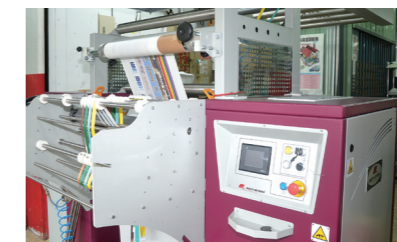
●幫助禮想家開拓掛式織帶客製化新市場的Monti-70高速織帶熱轉印機